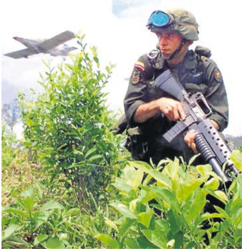
Un policía colombiano antinarcóticos patrulla un campo de coca.

INFORME MUNDIAL SOBRE LAS DROGAS 2009 http://minilink.es/rt